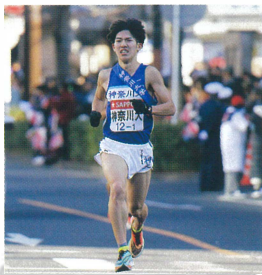
①陸上競技部駅伝チーム