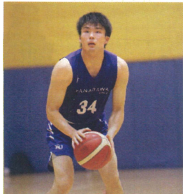
⑥男子バスケットボール部