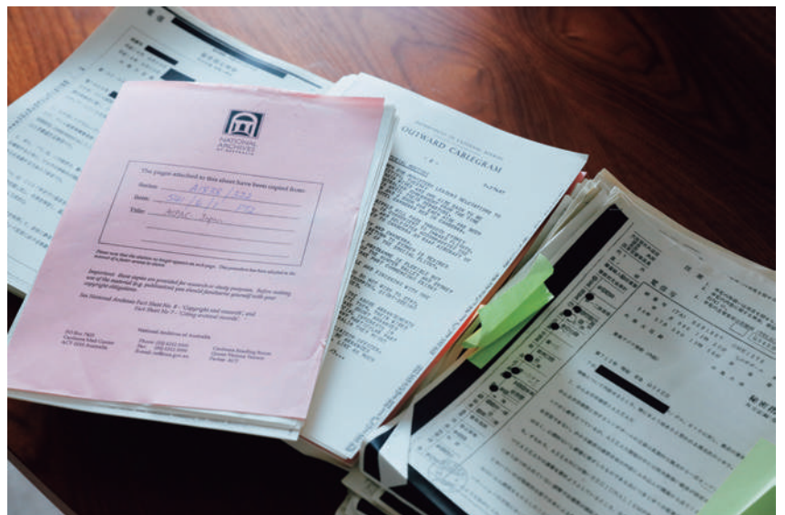
研究にはさまざまな一次資料、自ら行った関係者へのインタビュー、報道資料などを用いる。写真は日本の外交史料館やオーストラリアの資料館から取り寄せた資料、また日本政府への資料公開請求という手段で取り寄せた資料。