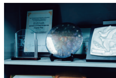
2008年、日本で日本建築学会賞を論文部門において受賞。写真はそのトロフィーだ。