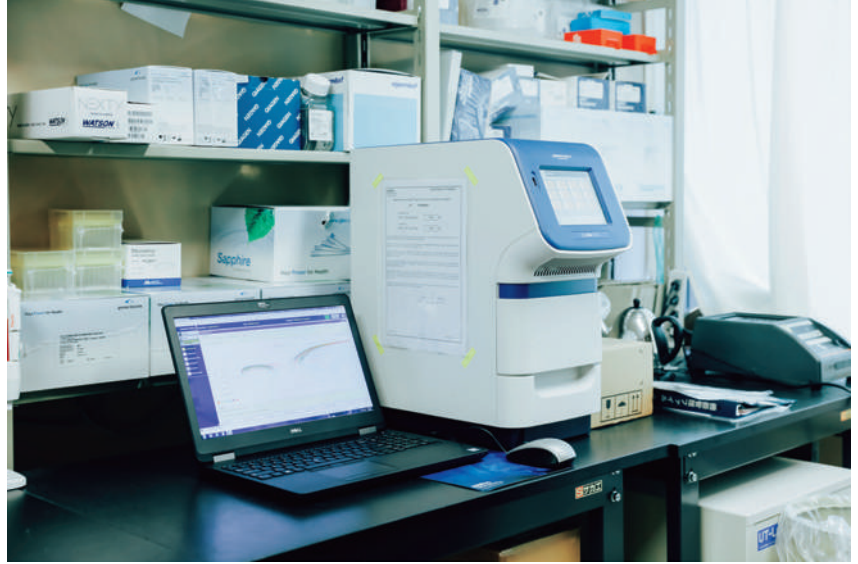
分子生物学研究に欠かせないツールであるリアルタイムPCRシステム。運動能力に関わる遺伝子発現の定量や遺伝子型の判別ができる。

「前半は余裕で走っていても、エネルギーが足りなくなる後半はペースが落ちてしまう。長距離の種目では、レース中のペースの変動は極力小さくして糖を温存する、つまり乳酸