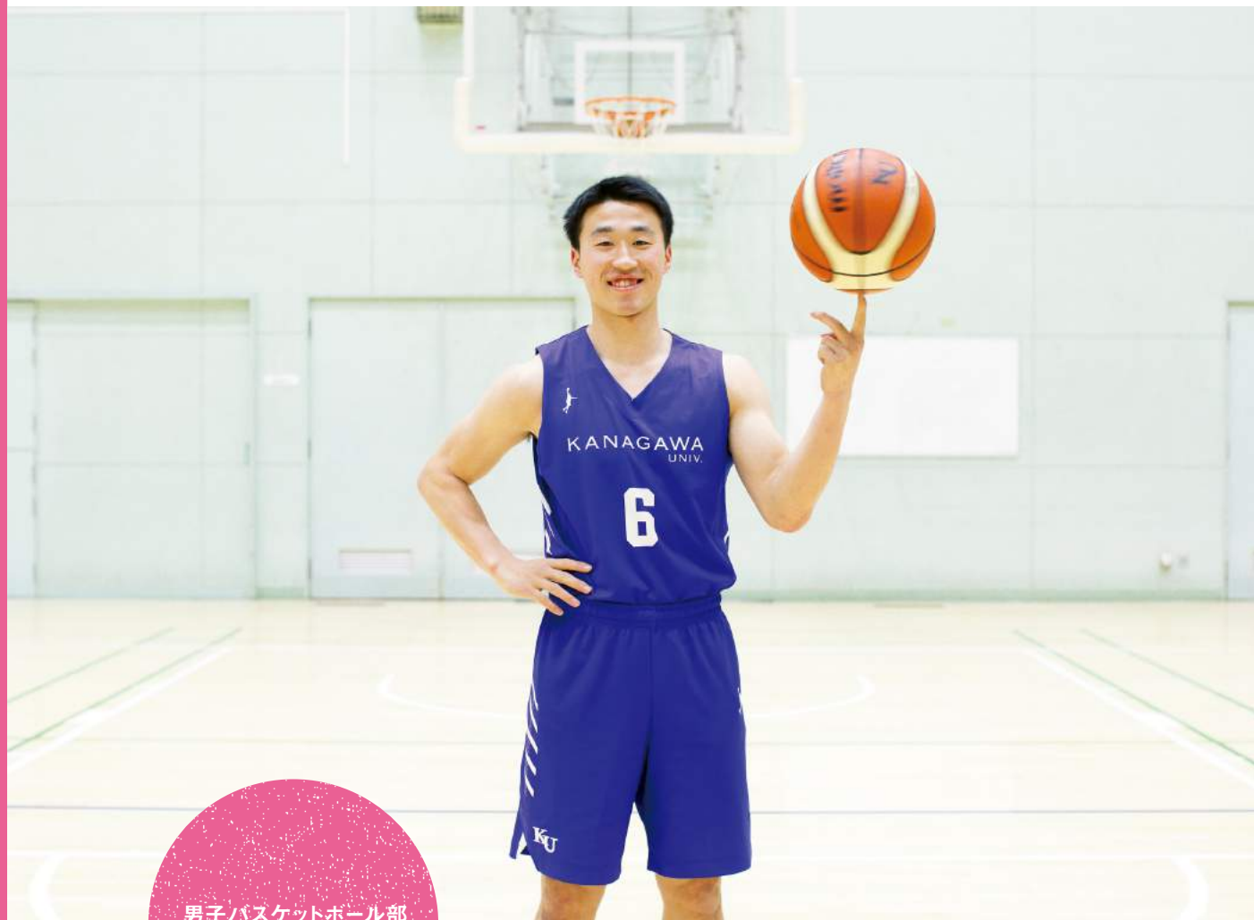
男子バスケットボール部 主将