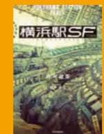
「横浜駅SF」 著者: 村瀬浩葉 イラスト: 田中達之 (カドカワBOOKS刊)

ずっと工事をしているなかなか完成しない横浜駅。その様子を揶揄し、「日本のサグラダ・ファミリア」と呼ばれている。「一体いつからやっているのか?」と調べてみると、なんと横浜駅が開業した1872年から! 関東大震災や、新たな沿線の乗り入れなどで工事が立て続け、100年以上経った今でも工事は続いています。そんな様子を描いた小説・漫画「横浜駅SF」も登場! 工事で巨大化した横浜駅が、やがて日本を占拠していく……という設定です。横浜駅を利用する学生には堪らない内容ですね!