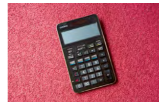
最上位機種の手帳電卓を受用。「お客様にも見える仕事道具はいい物を使いたいです」