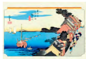
歌川広重の浮世絵「東海道五十三次」に描かれた「さくらや」が田中家の前身。