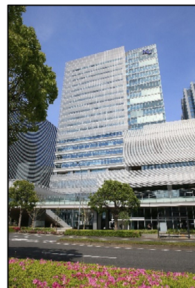
▲みなとみらいキャンパス