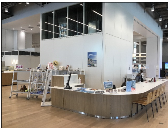
みなとみらいキャンパス1階に設置された観光を切り口とした教育研究活動の新しい拠点「観光ラウンジ」