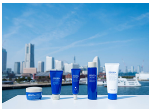
※神奈川大学オリジナルコスメティックシリーズ 「PROUD BLUE」(ブラウド ブルー) 全5商品