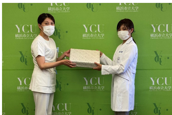
贈呈式の様子 左から