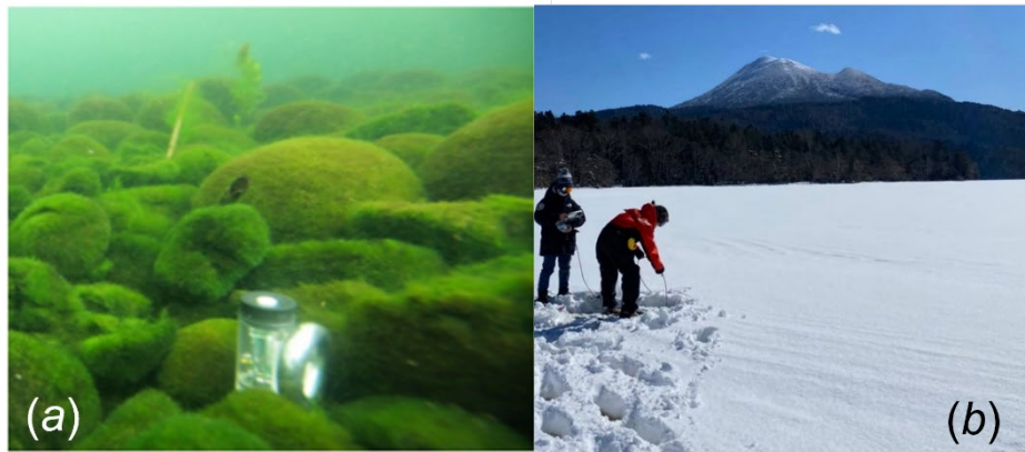
図 1. (a) 阿寒湖に生育する球状集合体マリモ。設置してある装置は光の強さを測るための光量子計。 (b) 1-3月の阿寒湖の様子。湖面は氷と積雪により覆われる。