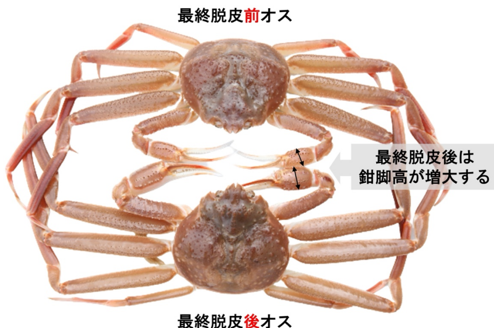
図1：最終脱皮前後のオスのズワイガニ 最終脱皮をすると鉗脚高（矢印部分）が増大する。

本研究は、基礎生物学研究所個別共同利用研究（19-357, 20-319）、基礎生物学研究所統合ゲノミクス共同利用研究（21-320）、科学研究費補助金（20H00630）の支援を受けて実施されました。