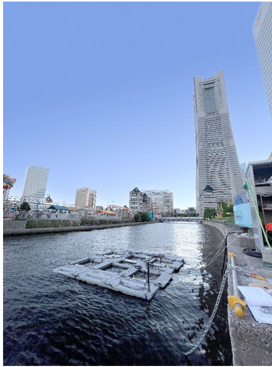
日本丸メモリアルパーク付近の水域に浮かべた海中ソーラーパネル