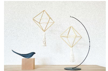
ヒンメリワークショップ 「フィンランド伝統の飾り」