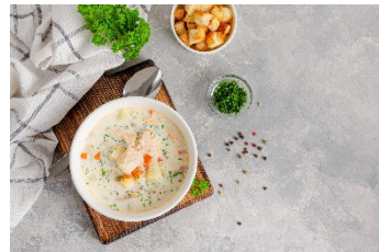
フィンランド伝統料理 「サーモンのあったかスープ」