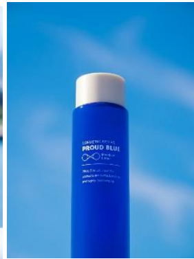
モイスチュアローション