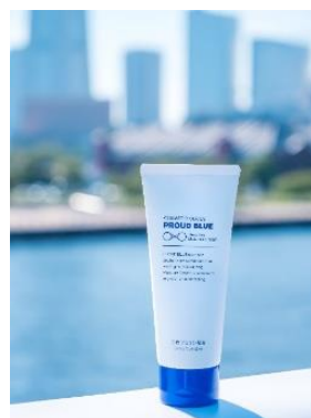
センシティブモイスチュア クリーム