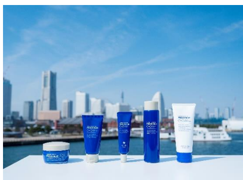
コスメティックブランド「PROUD BLUE」シリーズ