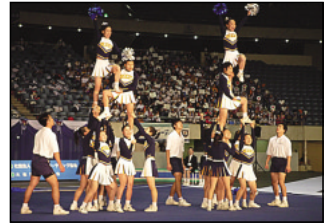
昨年度の大会の様子

●第22回全日本学生チアリーディング選手権大会 12月11日(土)~12日(日) 国立代々木競技場第一体育館