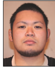
世界選手権出場の龍田太一選手