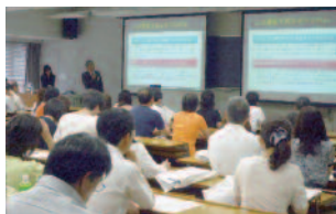
経済学部学修説明会 教員によるミニ講義も。