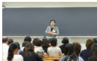
人間科学部学修説明会