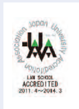
神奈川大学 法科大学院