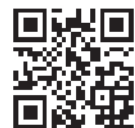
安否確認システム登録ページ