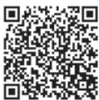
大規模災害に対する本学の対応。