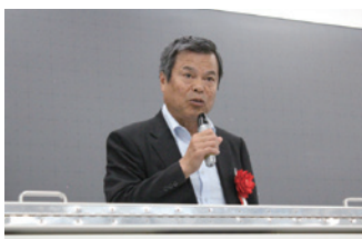
定時総会会長あいさつ

広報費 「神奈川大学サポートガイド2019」、「後援会報(年2回)」の印刷および発送費の支出とホームページの更新費です。