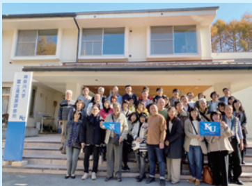
施設見学会の様子

保証人住所が変更になった場合は、学生が「WebSt@tionで変更手続き」または「各キャンパス学生課に届出」をしてください。